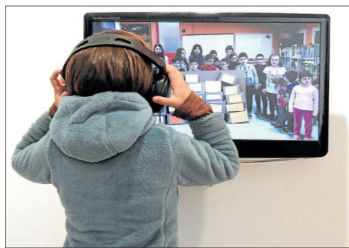
Un nen visiona el projecte de les escoles ZER Guillerries.

El programa Art i Escola ha comptat aquesta edició amb la participació de trenta-un centres educatius majoritàriament de la comarca d'Osona, però també del Bages, el Barcelonès, el Ripollès, el Solsonès i el Vallès Oriental. La iniciativa ha comptat amb 35 projectes realitzats i la implicació de 3.425 alumnes.