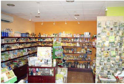
• K'BELLS HOME/DONA