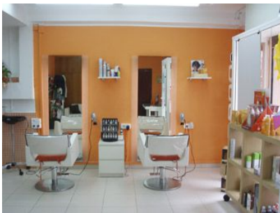
• CAL POQUET. LLIBRERIA I PAPERERIA.

un encert ja que contribueix "a donar visibilitat a la iniciativa, a treure-la fora de l'escola".